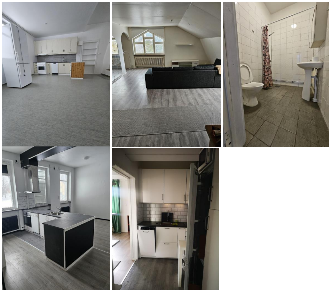
Interiörbilder lägenheter Nedre Vojakkala 12:21