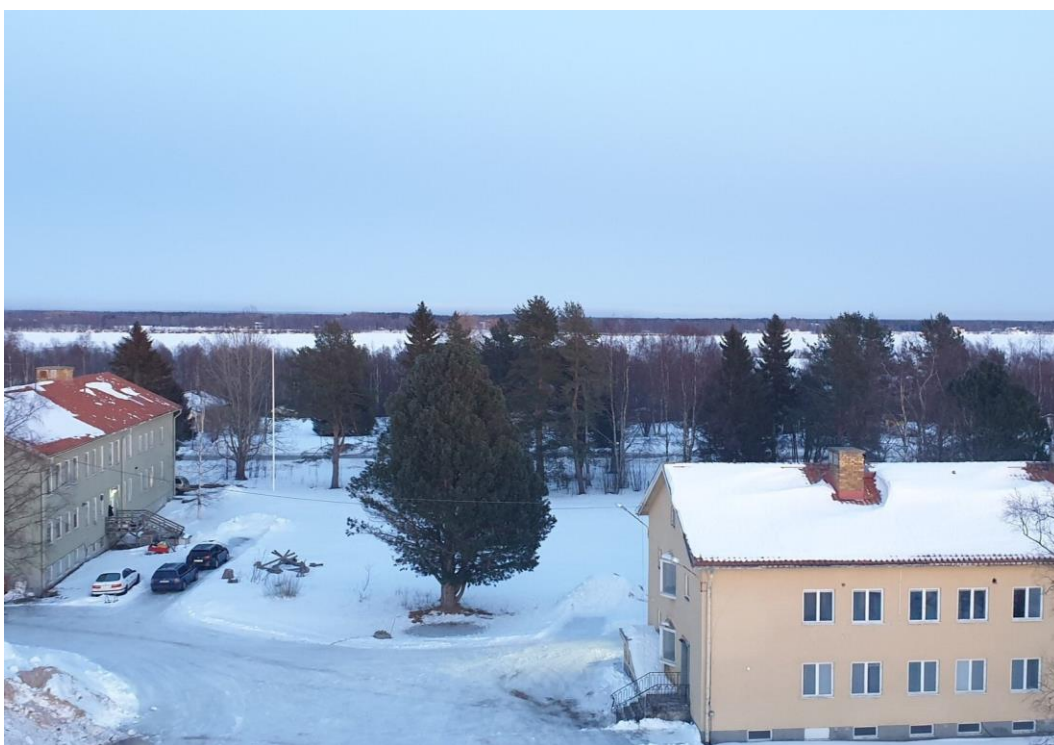
Tidigare skolbyggnader inredda med lägenheter

Anpassning av ytterligare ytor för bostadsändamål har påbörjats.