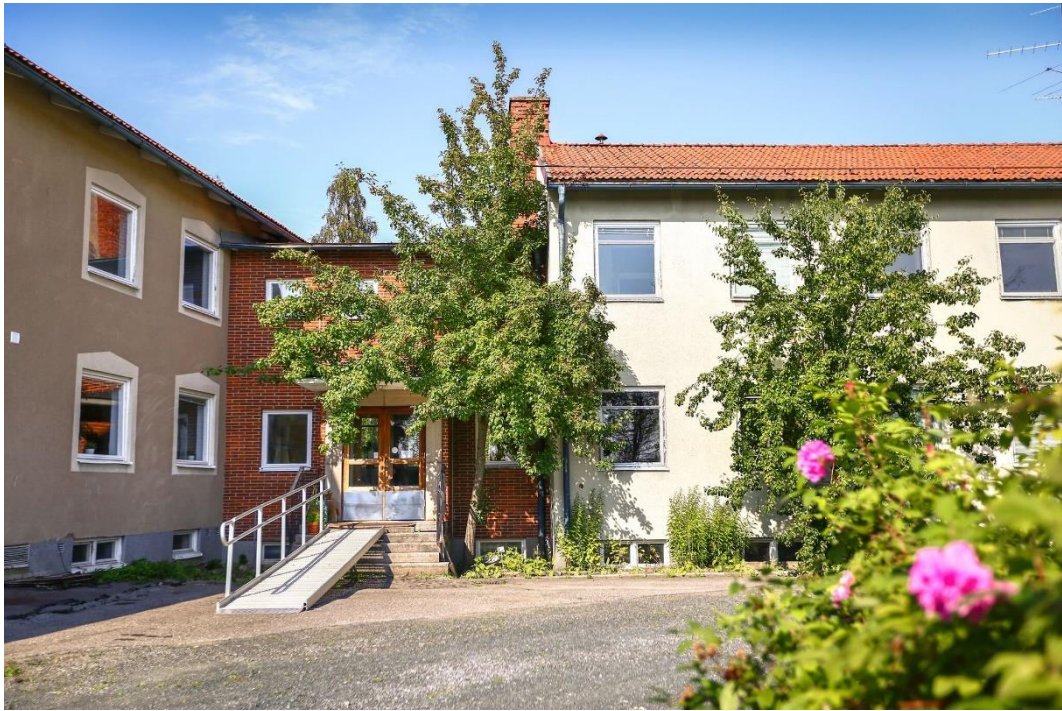
Tidigare elevhem och restaurangbyggnad